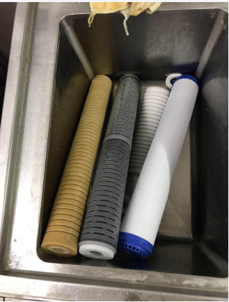
丢弃的旧滤芯图片