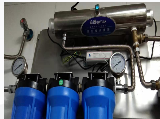
查看净水器压力表是否变为0