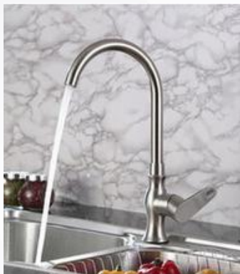
排空净水器内的水