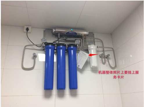
机器整体照片（服务卡片挂在机器上）